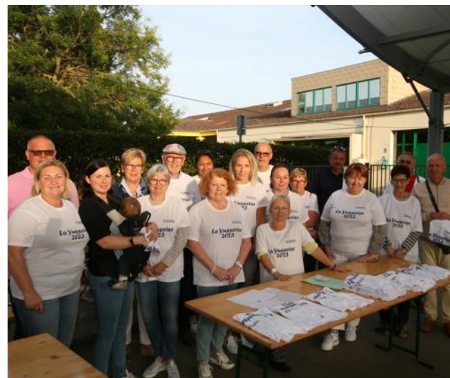
Les inscrits sont venus retirer leurs maillots place de la Mairie.

La commune de Basse-Ham s'est associée avec l'association Poussières d'étoiles pour la 5 e édition de la Yussoise qui comportera 10 km de course et 5 km de marche. La mairie a voulu y participer, invitant les Hamois à s'y inscrire.