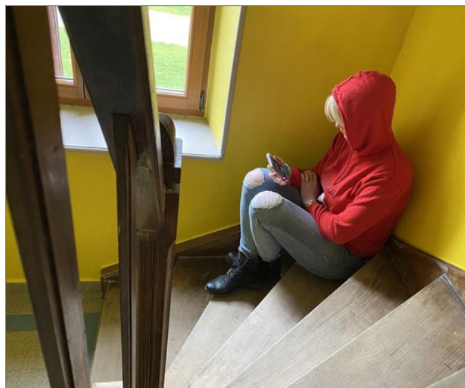
La CCAM, qui travaille sa politique en direction de la jeunesse, s'empare d'un sujet grave.

C'est dans ce contexte que la Communauté de communes de l'Arc mosellan organise une conférence-débat sur le sujet, jeudi 22 septembre à 17 h au domaine du moulin de Buding. L'invitation est destinée aux parents ainsi qu'aux jeunes de 11 à 17 ans. La conférence sera animée par un service spécialisé de la gendarmerie. L'entrée est libre dans la