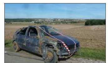
Le dépanneur vient de sortir le véhicule du champ.

La voie communale qui relie Stuckange à Luttange en passant par Volstroff est dangereuse. Dangereuse imputable essentiellement à une vitesse non adaptée au tracé de cette route étroite avec des bas-côtés qui laissent à désirer à certains endroits, même si les municipalités concernées font le maximum pour éradiquer le problème.